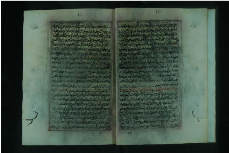
صورة الورقة الثانية من النسخة الثانية