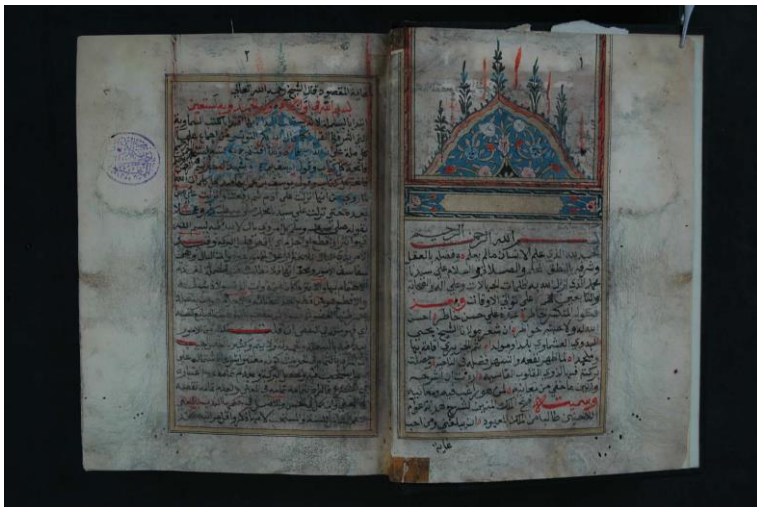
صورة الورقة الأولى من النسخة الأولى