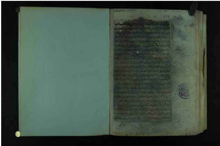
صورة الورقة الأخيرة من النسخة الثانية