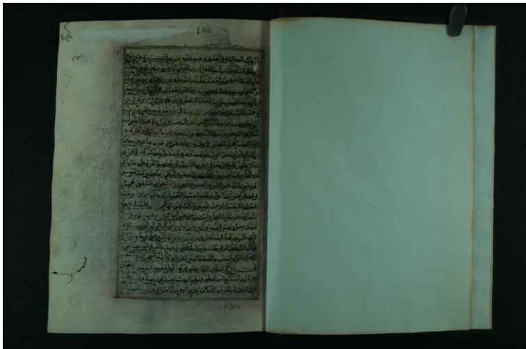
صورة الورقة الأولى من النسخة الثانية