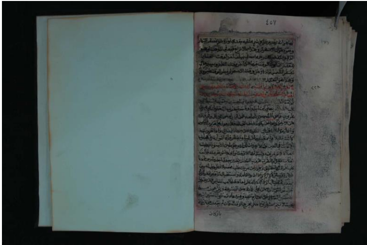
صورة الورقة الأخيرة من النسخة الأولى